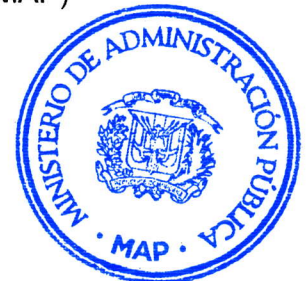
Darío Castillo Lugo Ministro de Administración Pública

Refrendada por el Ministerio de Administración Pública (MAP)